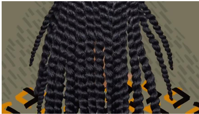
תמונה מס' 5. אסתר וונדה, 2017. פרט מתוך "תחזרי מאיפה שבאת". סרטון אנימציה

האמנית את תסרוקתה המסודרת בצמות שלא בסגנון מערבי, בכך שהיא מציגה את האישה כשגבה לצופים. בתמונה מס' 6 נראית הדמות הנשית עם צמותיה, הפעם במבט חזיתי, כשלשני צידיה מופיעים קופים בכלוב של גן חיות, הניתלים על חבלים המזכירים את הצמות השחורות של הדמות. הצבה אמנותית זו מבקשת להדגיש את הסטריאוטיפיזציה המנמיכה שחוות על נשים שחורות בישראל שבחורות להתהלך במרחב הציבורי בשיערן הטבעי ואת העלבונות שהן מקבלות על נראותן זו.