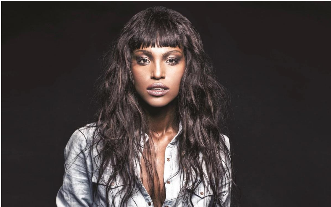
תמונה מס 2. דיוקן הדוגמנית טיטי איינאו. צילום: דניאל קמינסקי, מעריב, 2016

דיוקנה של מלכת היופי הישראלית טיטי איינאו (תמונה מס' 2), המצולמת אחרי ששערה קיבל טיפול והפך גלי ורך למראה, מגלם עקרון זה של התביעה החברתית לשינוי השער השחור והלבנתו. המאבק של נשים אתיופיות להיות ישראליות בכל מובן והיבט של החיים כולל אם כן גם מאבק יומיומי בשער. נראה שלכל הנשים יש hair issues, אך בקרב נשים שחורות, ההתמודדות הזאת היא מאבק יומיומי בעל משמעויות שייחודיות להן כקבוצה עם פנוטיפ שיש לו סטיגמה שלילית – היות "שחורה".