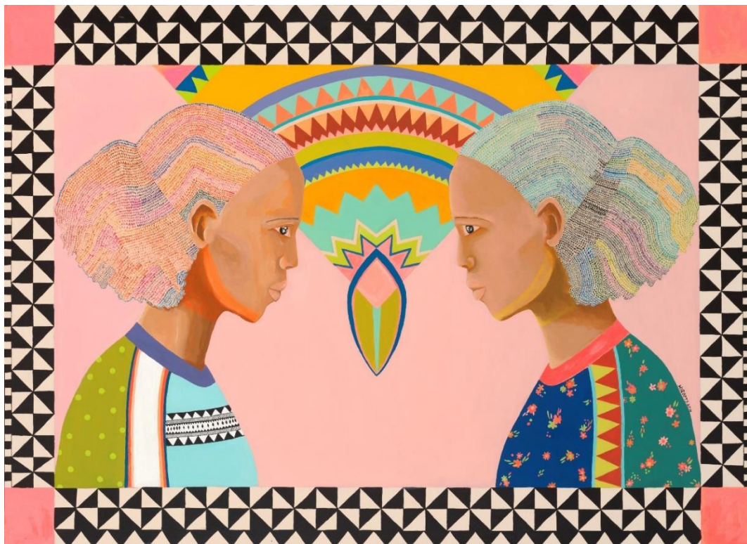
תמונה מס' 3. הירות יוסף, "אללטה", 2014, אקריליק על עץ, 139.7*101.6 ס"מ

באופן דומה אמניות כמו הירות יוסף ונירית טקלה מנכיחות ייצוגים וצבעים אחרים ביצירות האמנות שלהן.